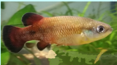
PRESENTATION DE VIVIPARES DE FORMES NATURELLES