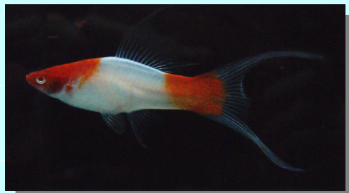
CONCOURS INTERNATIONAL XIPHO, MOLLY, PLATY