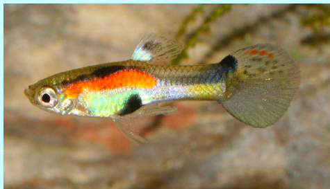
CONCOURS INTERNATIONAL DE WINGEIS